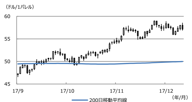
【図表2：WTI原油先物価格と200日移動平均線】

(注) データは2017年9月1日から12月12日。