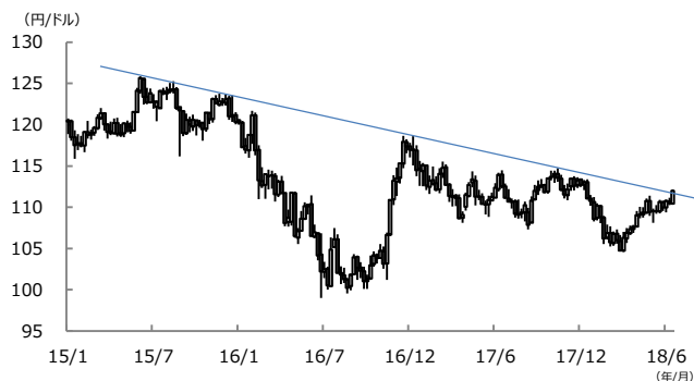
【図表2：ドル安・円高のトレンドライン】