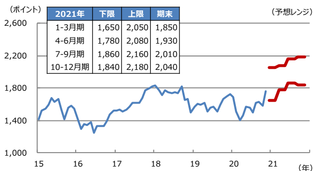
【図表1：東証株価指数（TOPIX）の予想レンジ】

(注) データは2015年1月から2020年11月。2020年12月18日時点の三井住友DSアセットマネジメントによる予想。太線は予想レンジの上限と下限。