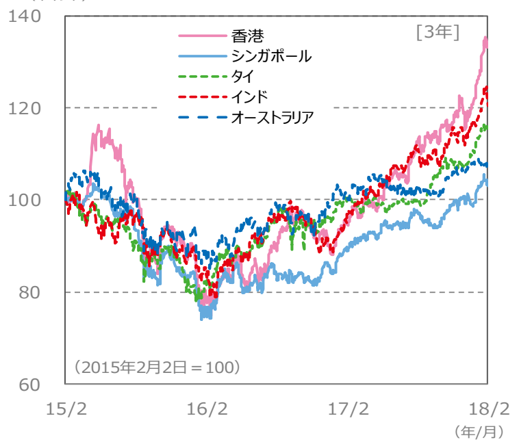
【国・地域別の株価指数の推移】