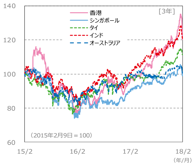
【国・地域別の株価指数の推移】 [3年]