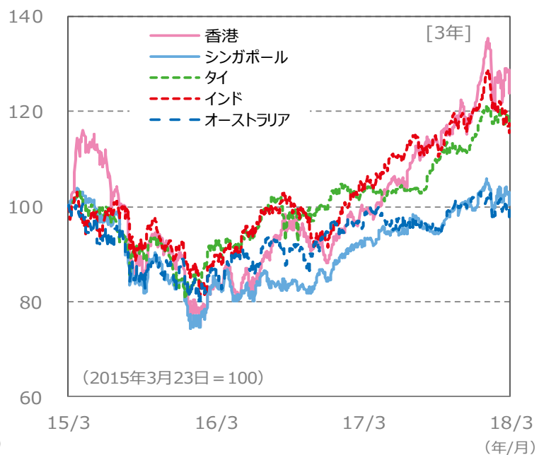
【国・地域別の株価指数の推移】 [3年]