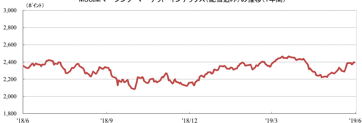
MSCIエマージング・マーケット・インデックス(配当込み)の推移(1年間)