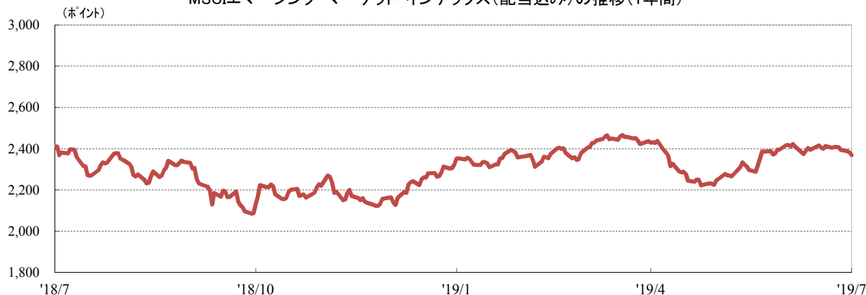
MSCIエマージング・マーケット・インデックス(配当込み)の推移(1年間)