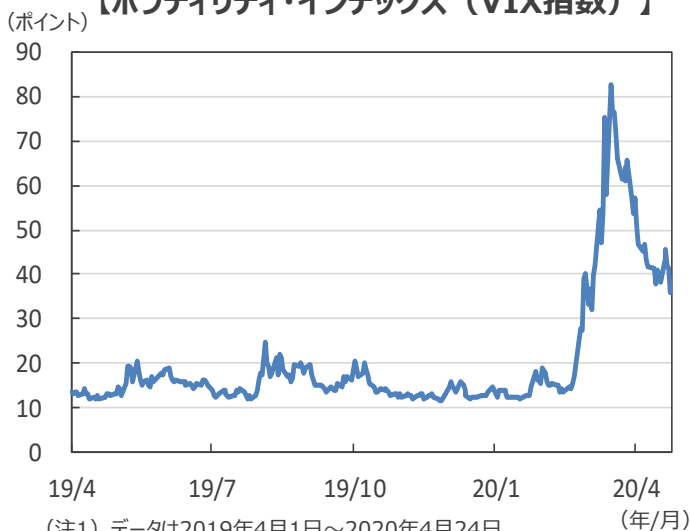
【ボラティリティ・インデックス（VIX指数）】

(注1) データは2019年4月1日～2020年4月24日。 (注2) VIX指数：シカゴ・オプション取引所（CBOE）で取引されるS&P500オプション価格から算出される潜在的価格変動率（インプライド・ボラティリティ）から算出。原指数であるS&P500種指数の値動きが大きくなるほど、値が大きくなる。 (出所) Bloomberg L.P.のデータを基に三井住友DSアセットマネジメント作成