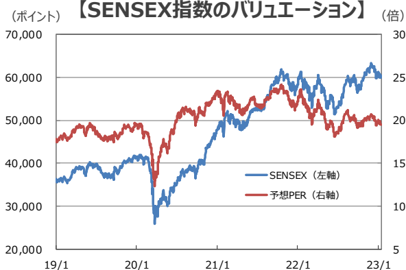
【SENSEX指数のバリュエーション】

(注1) データは2019年1月1日～2023年1月16日。 (注2) 予想EPSと予想PERは今後12カ月ベース。