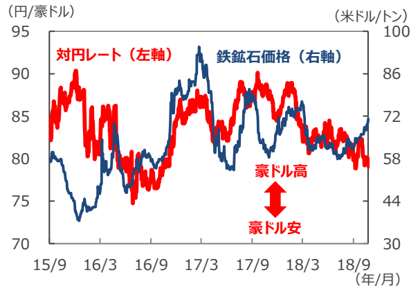
【豪ドル円レートと鉄鉱石価格】

(注) データは2015年9月1日～2018年10月24日。ただし、為替の直近値は2018年10月25日12時30分時点のもの。(出所) Bloomberg L.P.のデータを基に三井住友アセットマネジメント作成