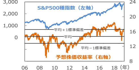
(ポイント) 【予想株価収益率の推移】

(注) データは2006年1月3日～2019年3月22日。予想株価収益率の平均、±1標準偏差の計算期間は2006年1月3日～2019年2月28日。予想株価収益率を算出する際の1株当たり予想利益は12カ月先予想（予想はBloomberg L.P.集計）。