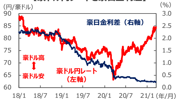
【豪ドル円レートと豪日金利差】