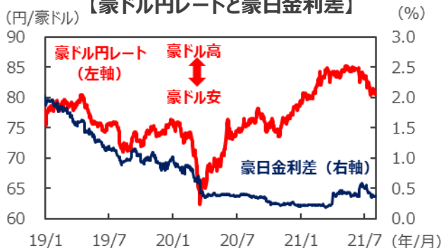
【豪ドル円レートと豪日金利差】

(注) データは2019年1月1日～2021年8月3日。 豪日金利差は3年国債利回りの差。