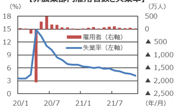
【非農業部門雇用者数と失業率】