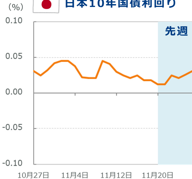
🇯🇵 日本10年国債利回り