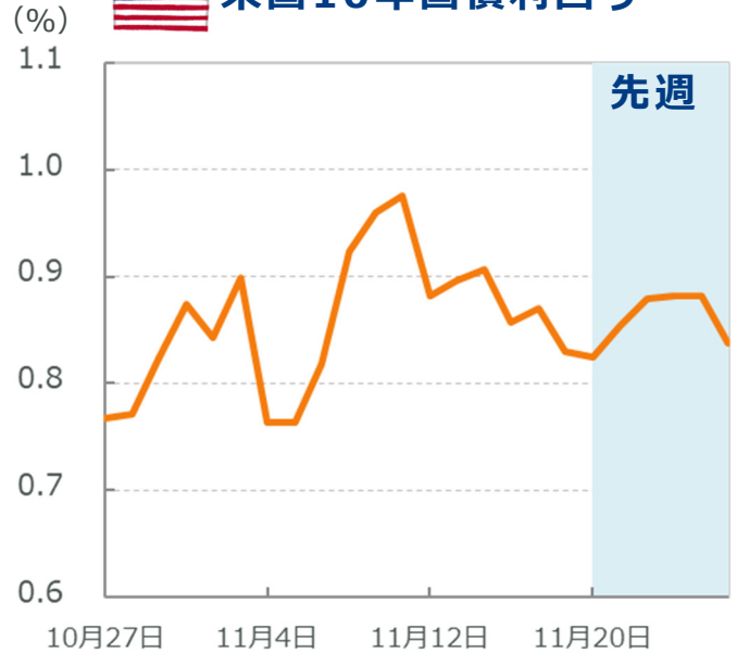
🇺🇸 米国10年国債利回り